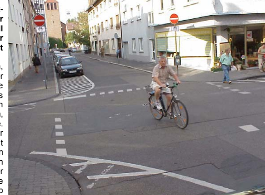
Vorschlag zur Verkehrsführung an der Kreuzung Langstraße / Steinheimer Straße: Statt Stoppschildern eine Rechts-vor-Links Regelung