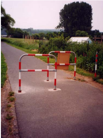
Radverkehr auf Radwegen unerwünscht? Zumindest kann diese Hindernis mit Kinder- oder Einkaufsanhängern nur schwer passiert werden.

(Rodenbach) Am 24. Juli kamen auf Anregung des Allgemeinen Deutschen Fahrrad-Clubs der Leiter der Rodenbacher Ordnungsbehörde, der Fahrradbeauftragte der Gemeinde und Mitglieder der ADFC-Ortsgruppe Rodenbach zu einem Gespräch zur Situation des örtlichen Radverkehrs zusammen. Bei dem rund zweieinhalbstündigen Treffen