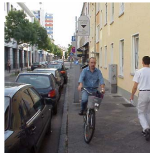
Mangels geeigneter Möglichkeiten ist dieser Fahrradfahrer in der Steinheimer Straße verbotenerweise auf dem Bürgersteig unterwegs

Die Möglichkeit Einbahnstraßen für den Radverkehr zu öffnen, besteht seit der StVO-Novelle von 1997. Weil es trotz vieler positiver Modellversuche heftigen Widerstand gegen diese Regelung gab, wurde in der StVO-Novelle diese Regelung noch bis 1998 befristet. Doch auch innerhalb dieses einen Jahres ergaben sich auch keine neuen, negativen Erkenntnisse. Im Gegenteil: Der Gesetzgeber überlegt derzeit, ob die engen Kriterien (bezüglich Fahrbahnbreiten und der Vorgabe, dass die Einbahnstraße innerhalb eines Radnetzes liegen muss) aufgeweicht werden sollen. Die Verkehrssicherheit wurde über mehrere Jahre von der Bundesanstalt für Straßenwesen untersucht und positiv bewertet. Aufgrund dieser guten Erfahrungen wurden in vielen Städten diese fahrradfreundliche Maßnahme in immer mehr Straßen umgesetzt. In Frankfurt ist die Straßenverkehrsbehörde derzeit im Westend aktiv, anschließend werden im Nord- und Ostend Einbahnstraßen für den Veloverkehr ausgeschildert.