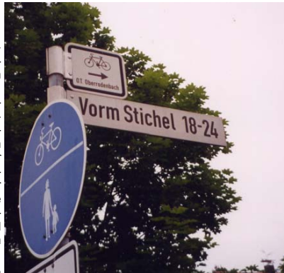
Für „Pfadfinder“ ein Hinweisschild nach Oberrodenbach. Es soll durch ein gut lesbare Radhinweisschild (grüne Schrift auf weißem Grund) ersetzt werden.

Der ADFC monierte Radwege, die scheinbar im Nichts enden, schadhafte Fahrbahnoberflächen mit Frost- und Wurzelaufrüchen, zu eng bemessene Umlaufsperrn, scharfkantige oder zu hohe Randsteine, fehlende Warnschilder und kaum noch wahrnehmbare Fahrbahnmarkierungen. Neben Hinweisen auf verwirrende Beschilderungen wurden den Verkehrsexperten der Gemeinde auch Vorschläge unterbreitet, wo künftig günstige Routen für die Radler im Gemeindegebiet verlaufen könnten. In dieser Sache ist die Gemeinde allerdings schon vor einiger Zeit aktiv geworden. So konnte Amtsleiter Puhl berichten, dass künftig eine ergänzende Wegweisung von Fahrradrouten im Gemeindegebiet mit einer Beschilderung vorgenommen werde, wie diese die Forschungsgesellschaft für Straßen- und Verkehrswesen empfiehlt, nämlich